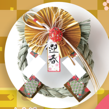
しめかず 注連飾り・ しめなわ 注連縄(べ縄)

年神さまをお招きするために大掃除を終え、「清浄な家」であることとしるしとして玄関に飾ります。神棚の「しめ縄」も毎年、新しく取り替えます。