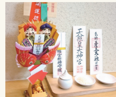
鳥居付きお神札飾り