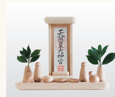
神具付きモダン神棚