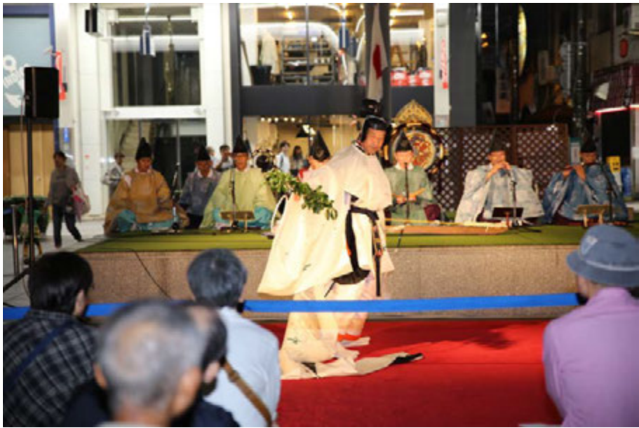
舞楽 人長舞 其駒