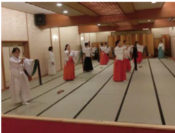
指導者講習会の様子