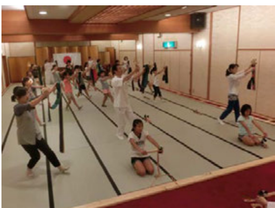
初級者講習会の様子

初級者講習会 八月四日～五日 二十一名受講 指導者講習会 八月五日～七日 十三名受講