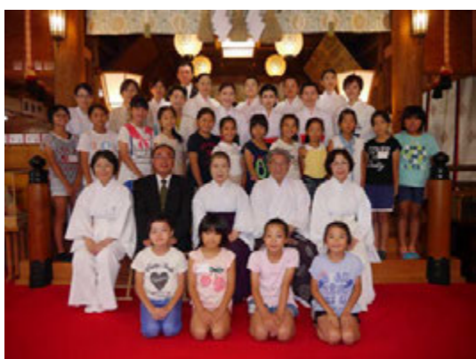
初級者閉講式、指導講習受講生と一緒に