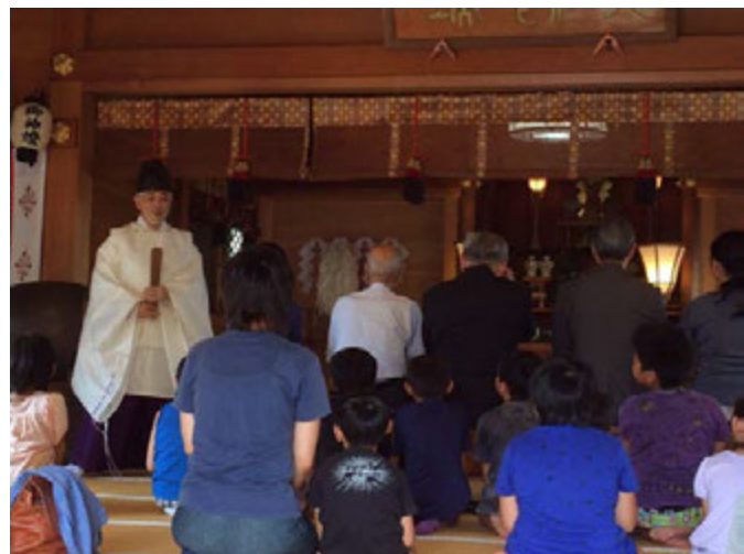
奥田神社 二宮宮司様のお話し

行灯作り、火きり体験、ゲーム、古事記読み聞かせ、 DVD鑑賞、神社参拝、雅楽鑑賞など神社に親しみ 楽しい一日を過ごしました。