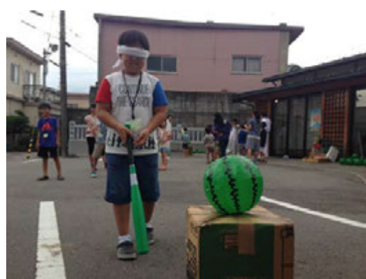
すいか割りに挑戦!