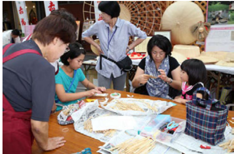
菅のコースター作り